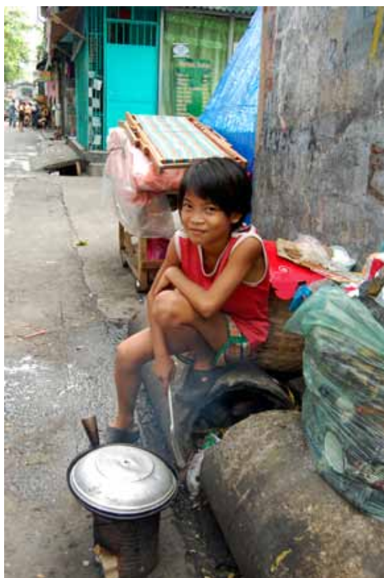
Hjemmebesøk i slummen