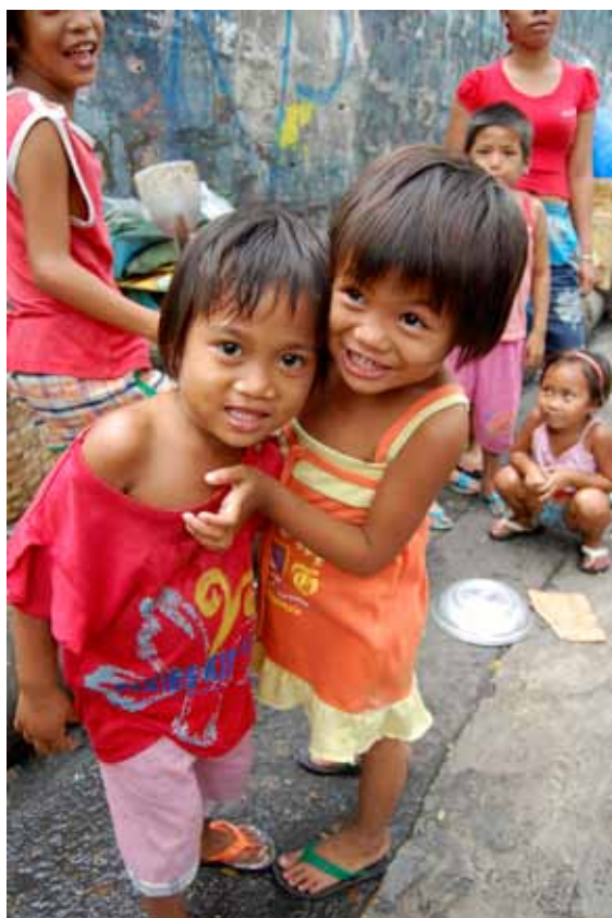
To små sjarmtroll som er takknemlige for den hjelpen de får fra deg