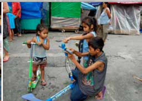
Lek i gata