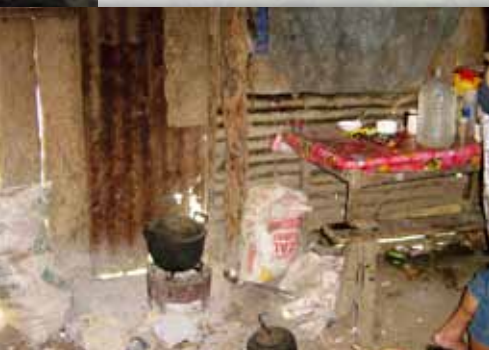
Kjøkken i slummen, eller omvendt

Vår tilstedeværelse gir en forandring som varer.