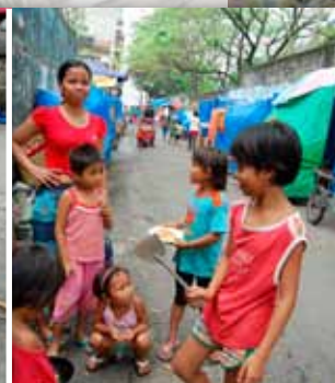
Typisk boligkvarter i slummen