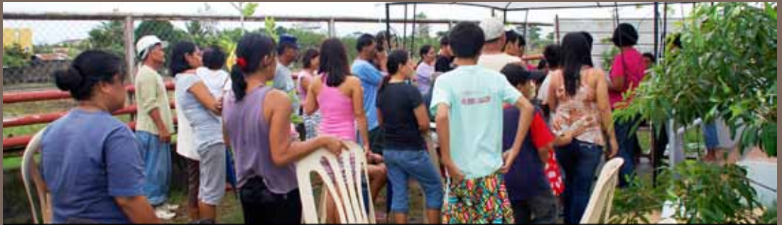
Det dannet seg raskt lo når vi har medical mission