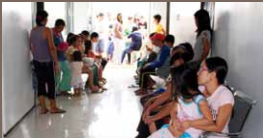
Medical Mission på Barmhjertighetens Hospital